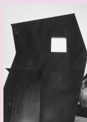
REFRACTION HOUSE (篠目町)