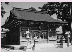
池浦天満宮 (池浦町)

申込用紙▼各園で配布中 申し 込み・問い合わせ▼10月1日(火) から直接希望する園へ ※詳し くは本紙前号をご覧ください。