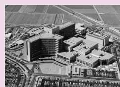
安城更生病院 (安城町)