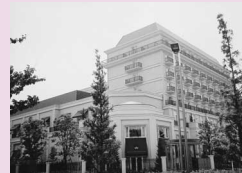
HOTEL GRAND TIARA 安城高砂殿 (二本木町)