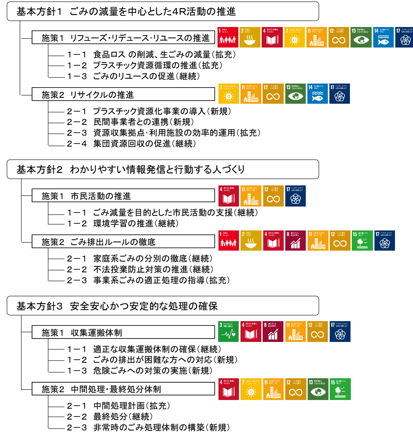
図 2 ごみ処理基本計画の施策体系