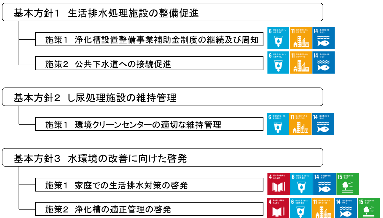
図 3 生活排水処理基本計画の施策体系