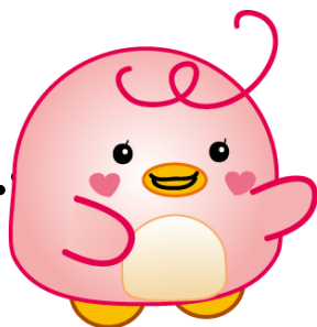
市民交流センターマスコットキャラクター