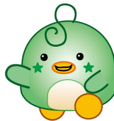
市民交流センターマスコットキャラクター

地域の課題を解決するために活動しているのは、実は町内会だけではないんだ。子育てや福祉、防災など、特定の分野に関する活動を主に行う団体のことを、「NPO」や「市民活動団体」というんだ。「NPO」とはNon-Profit（非営利）Organization（団体組織）の略で、社会のためになる活動を自主的にしている団体のことなんだよ。