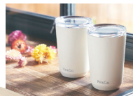
協力:NISSHA(株) NECソリューションイノベータ(株)