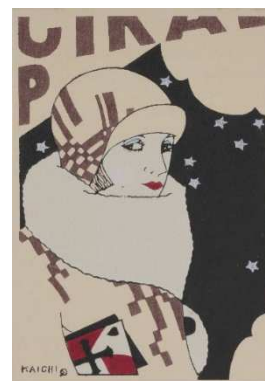
『二号街の女』絵はがきセット 京都京極さくら井屋