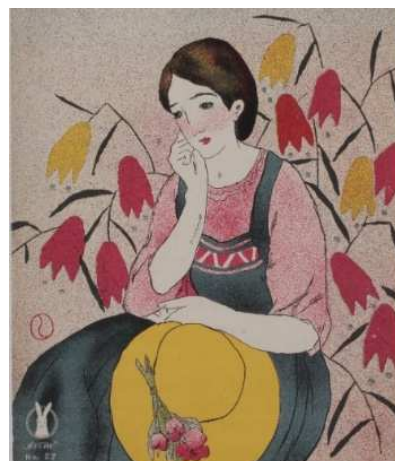
『唯我心悩ぞ知らめ』 (セノオ楽譜二七番)6版 セノオ音楽出版社