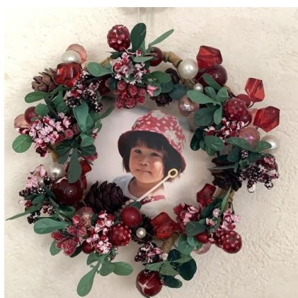
クリスマスオーナメント