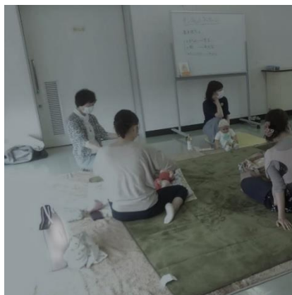
ベビーマッサージ