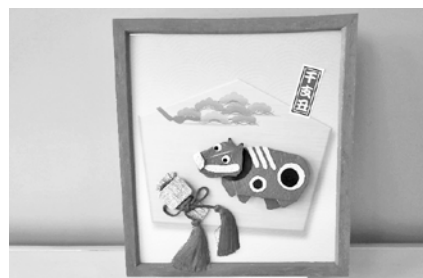
季節の折り紙を楽しむ!干支の色紙