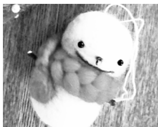
羊毛フェルトでクリスマスグッズを作ろう!