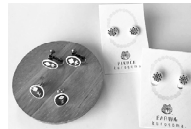
レジンで作る北欧風アクセサリ

定員 各回10名 回数 1回 時間 ①10:00~11:30 ②13:00~14:30 講師 kurogoma. 参加費 1,200円