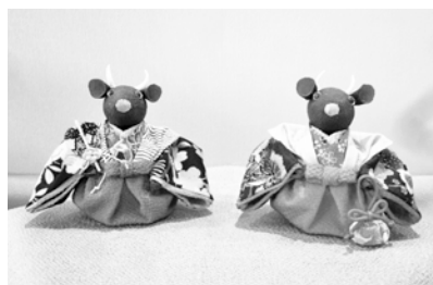
ちりめんで作るかわいい干支小物