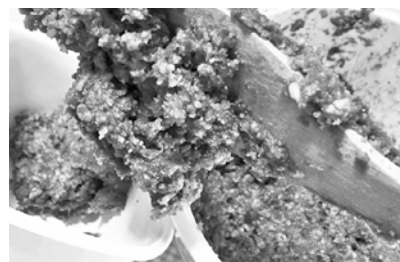
ウイルスに負けない!こだわり味噌の仕込み体験