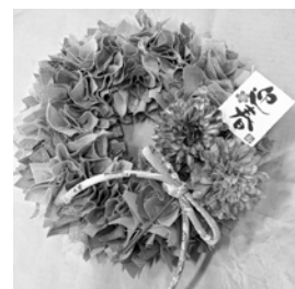
正月を彩る布リース飾り