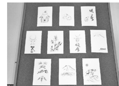
年賀状を描こう!薄墨で描く正月のイラスト