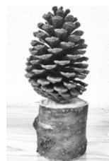
美園公園の木で アートしよう