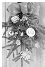
スワッグで クリスマスの壁飾り