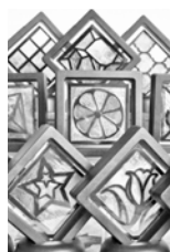
魅惑のシャイン カービング