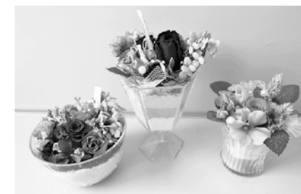
パウダーオアシスでフラワーアレンジ!