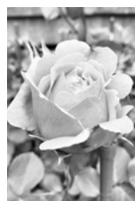
春に素敵なバラを 咲かせましょう