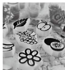
消しゴムはんこの世界