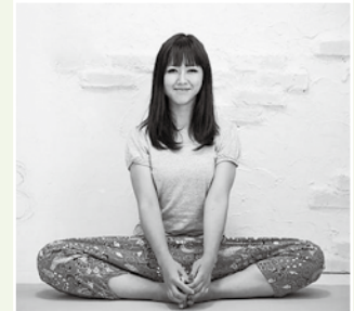
やりたいことを仕事にしよう（作野公民館）