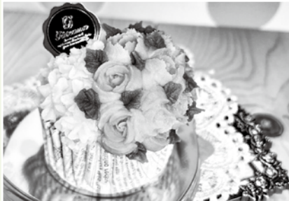
おいしい！あんフラワースイーツ（中部公民館）