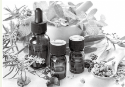
スリムな身体へ導くセルフリンパケア（北部公民館）