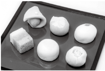
季節を感じる「春の和菓子」(写真はイメージです)

対象 18歳以上 定員 8名 回数 3回 時間 13:30~15:00 講師 清水崇司 参加費 2,900円