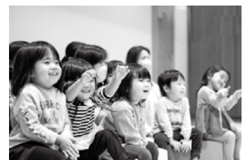
親子でスパークルトレーニング