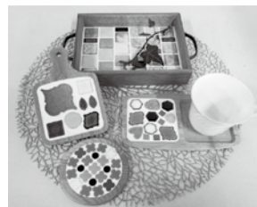
暮らしを彩るタイルクラフト