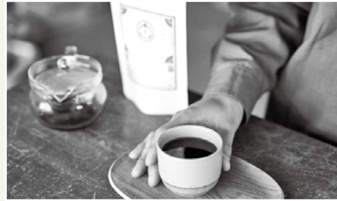
スペシャルティコーヒー講座（桜井公民館）