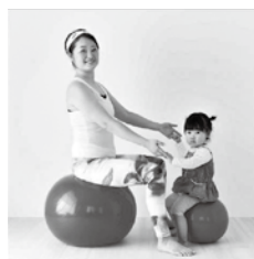
親子で楽しく♪バランスボール