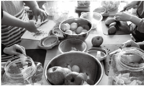
毎日簡単！手作りで腸活（作野公民館）