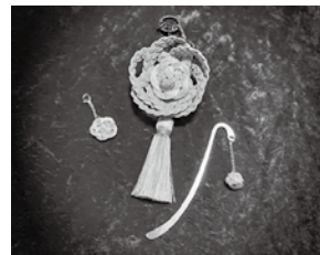
大人かわいい水引