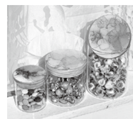
アルコールインクアート