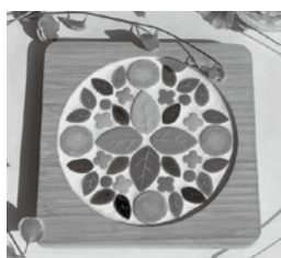
モザイクタイルの鍋敷き

対象 18歳以上 定員 8名 回数 1回 時間 13:00～15:00 講師 RISA 参加費 2,000円