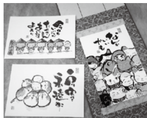
奏筆®~なんかいいがなぜかいい~

対象 18歳以上 定員 12名 回数 4回 時間 13:30~15:00 講師 馬淵将樹 参加費 1,300円