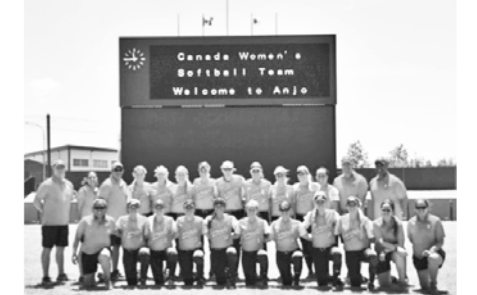
カナダ代表チーム安城合宿(2018)

安城市は、ソフトボールとの関係が深い市です。全国でも数少ないソフトボール専用球場が2面あり、整備は安城市体育協会の皆さんが一手に引き受けて、いつもグラウンドコンディションは最高です。ソフトボールはアメリカ発祥のスポーツで、日本に紹介されたのは1921年と言われています。その後、1950年に行われた第5回国体大会(国体)で初めて正式種目として採用され、その会場になったのが安城でした。安城市は実は「国体ソフトボール競技発祥の地」なのです。