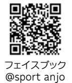
フェイスブック @sport anjo

やオリンピックに向けて準備が進むカナダチームの情報などを、Instagramとフェイスブックで紹介しています。インスタ映える最近のものからセピア色の貴重な記録写真まで、さまざまな画像を見て楽しむことができるだけでなく「ソフトボール博士」にもなれるかもしれません。