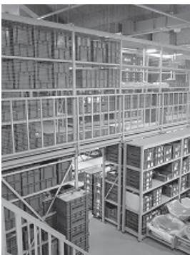
写真2 考古資料収蔵庫

まいぶんセンター3階の秘密の部屋、それは「考古資料収蔵庫」です。考古資料収蔵庫は、まいぶんの「要」と言えます。これまで安城市で出土した遺物や、市民の方から寄贈された遺物などを全て収蔵しています。ここにある遺物は全て100年後、1000年後、その先も後世に残していくために収蔵されています。