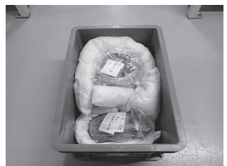
写真3 コンテナの中身

写真2・3 部屋に設置された棚には、所せましとコンテナが積まれています。コンテナの中には、今までに行われた調査で出土した遺物約30,000点以上が保管されています。