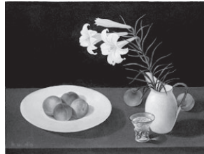
久野和洋《百合と桃》

久野和洋の《百合と桃》は、瑞々しい桃と生命力に溢れた百合の花を描いた作品です。皿に盛られた4つの桃と花瓶に生けられた百合、画面を真っ直ぐに横切るテーブルが作り出す安定した構図は、見る者に穏やかさを与えてくれます。一方で、テーブルの上を無造作に転がる2つの桃は、この整った静謐な空間に少しの歪さを生み出しています。