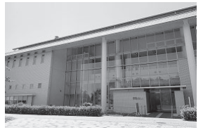
写真1 埋蔵文化財センター外観

そんな「まいぶんセンター」、令和5年(2023)で開館20周年を迎えます。ここで改めてみなさんに「まいぶん」を知ってもらうために、まいぶんセンターを探検します!