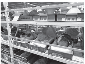
探検⑤ 1階の展示収蔵庫。この部屋では、市域の歴史を感じられる遺物はどんなものか、またそれらをどのように収蔵しているのかを分かりやすく展示しています。

まいぶんセンターを訪れたことのある方は1階にある、「市内発掘調査報告展」、「整理室」、「展示収蔵庫」、「創作実習室」をご覧になったかと思います。実はこの建物は4階建てで、その3階には一般公開していない秘密の部屋があるのです。