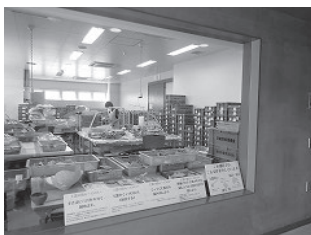
探検③ 整理室では、土器の洗浄・接合・実測・発掘調査の報告書作成を行っています。