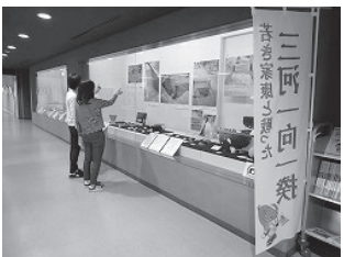
探検② 市内遺跡発掘調査報告の展示