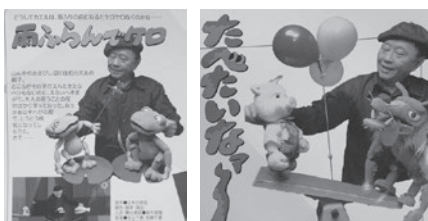
夢知遊座の人形劇を観よう!

日 9/30(土)10:40~11:40 会 桜井公民館1階 多目的ホール 对 市内在住の乳幼児親子~18歳未満の児童及び付き添いの大人 定 70名程度 持 座布団 申 9/2(土)9:30~児童センターにて受付(先着順・開所時間内・電話申込不可) 問 桜井児童センター 99-3313