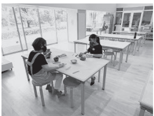
探検④ 創作実習室では土器づくり教室が開催されています(毎週水曜日)。