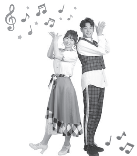
ファミリーコンサート 「うたのギリギリおにいさん&おねえさん」 IN桜井子どもハッピーハロウィン祭

日 11/25(土)10:00~11:30 会 昭林公民館 对 市内在住・在勤 定 20名 持 ノートパソコン(Mac不可) 問 昭林公民館 77-6688