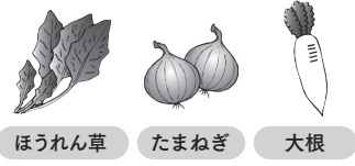
ほうれん草 たまねぎ 大根