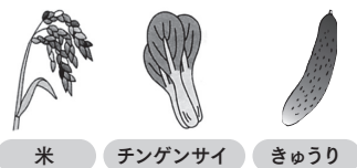
米 チンゲンサイ きゅうり