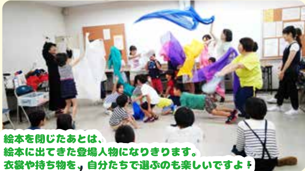
絵本を閉じたあとは、絵本に出てきた登場人物になりきります。衣裳や持ち物を、自分たちで選ぶのも楽しいですよ!