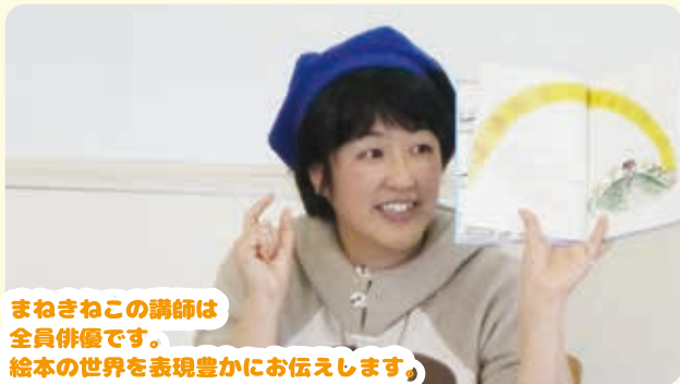
まねきねこの講師は全員俳優です。絵本の世界を表現豊かにお伝えします。