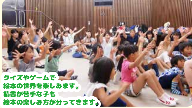
クイズやゲームで絵本の世界を楽しみます。読書が苦手な子どもも絵本の楽しみ方が分ってきます。