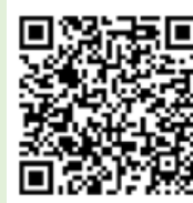
「ラーケーションの日」 活動例