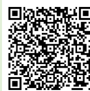
「ラーケーションの日」 ポータルサイト

「ラーケーションの日」には、様々な活 動ができます。どのような活動ができ るのか、どうやって「ラーケーションの日」を取ればよいの かなど、興味をもった人は、おうちの方に配った「保護者 用リーフレット」を見たり、右の二次元コードから、「ラーケ ーションポータルサイト」の「『ラーケーションの日』活動例」 を見たりしながら、おうちの方と話し合ってください。