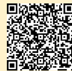
「ラーケーションの日」ポータルサイト

※ 県の Web ページ「ラーケーションの日」ポータルサイトには、計画づくりに活用できる「ラーケーションカード」や、いろいろな学びができる場所を紹介しています。参考にしてください。