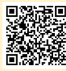
「ラーケーションの日」活動例