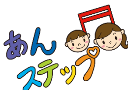
あんステップ♪ロゴマーク

それぞれのこどもに応じた支援が行われ、利用する親子が安心して集え、心のより所となり、ここから「ステップ(成長)」して、こども達の人生がすてきなものとなるように、との願いが込められています。