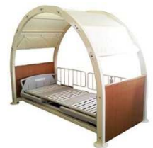
防災ベッドの一例