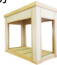
耐震シェルターの一例