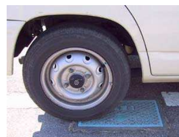
車の下とならないこと

容易に検針できない場所や、植栽の中、荷物等の下となりやすい場所、 特に駐車場に設置する場合は、車を停めてもメーターボックスの蓋が開閉でき、検針ができる位置としてください。