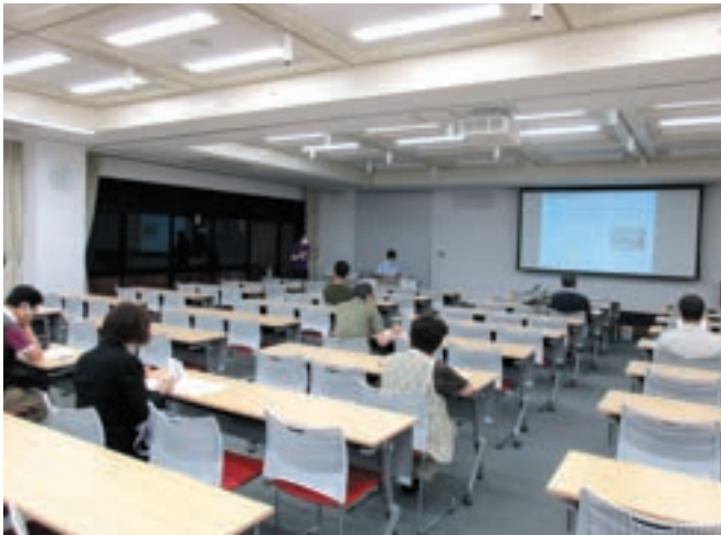
令和4年7月5日 地区別集会

その結果、要望する内容は、①早期の事業化、②JR安城駅前としてふさわしい整備のあり方の検討、③建物共同化検討の支援、④換地設計において積極的な集約換地手法や飛び換地手法の適用の4つの項目となり、令和4年8月30日に市へ要望書を提出しました。