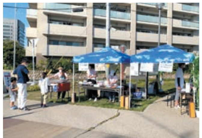
すえひろピクニックin安城七夕まつり