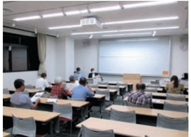
令和4年7月26日 第7回委員会