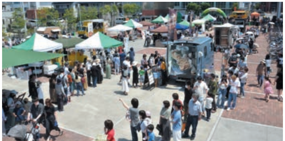
賑わいを見せるアンフォーレ