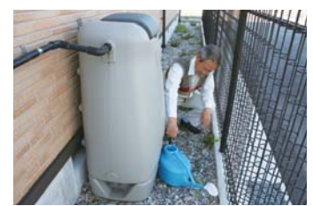
雨水タンクの水で 植木に散水できます

電気代が太陽光発電でまかなえることに驚きました。エコキュートや太陽光発電がついているので電気代は節約できます。IHも使やすく、30分たつと保温にしているでもスイッチが切れるので安心です。