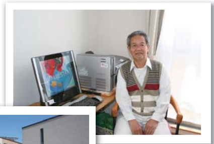
2階の1室は 町内会事務所 として使用