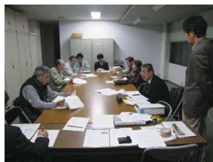
41街区協定書の最終確認作業