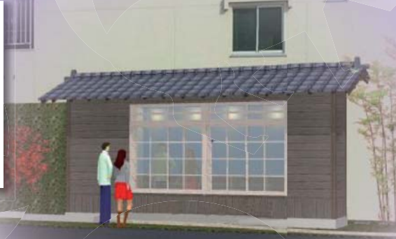
(この窓内に写真、書を展示します)