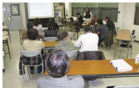
平成25年3月6日 計画的集団移転等勉強会