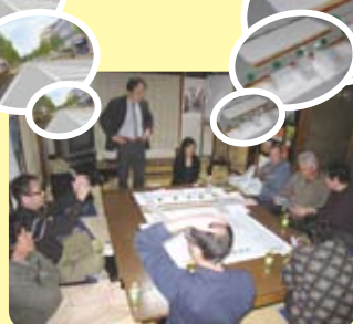
街なみづくりルール策定部会