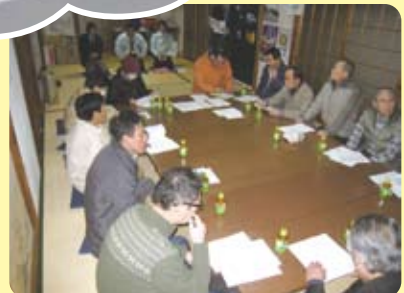
花ノ木まちづくり協議会 定例会