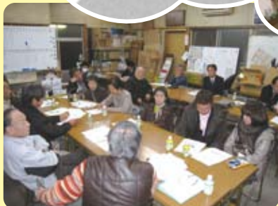
末広地区まちづくり協議会 委員会