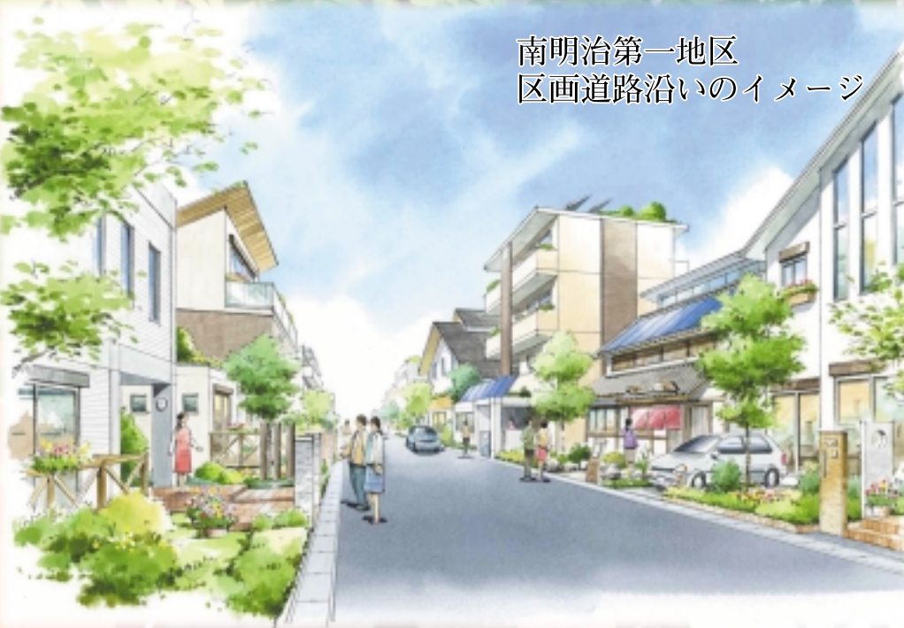
南明治第一地区 区画道路沿いのイメージ