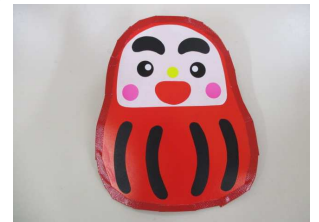
『ピッピだるま工作』