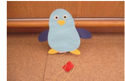
トコトコペンギン