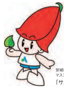
安城市 マスコットキャラクター 「サルビー」

安城こども BOOSTERS 子育て カレンダー お母さんの 産後のケア こどもの 健康のために 医療・救急 困ったときの 相談窓口 ひとり親 家庭への支援 障がいのある お子さんへの支援 保育園・幼稚園・ 認定こども園 一時的な預かり 地域の子 育て支援 親子で遊ぼう! お出かけ情報 災害に備えて