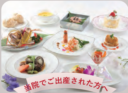
当院でご出産された方へ

ご夫婦で新しいご家族の誕生をお祝いしていただけるお祝い膳をご用意！その他に、オリジナルアルバム、アロママッサージの施術をプレゼント♪ ご出産後にご利用いただけるパジャマやタオルは無料をご用意