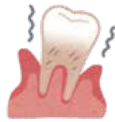
歯周ポケットの保有者の割合(平成28年歯科疾患実態調査)