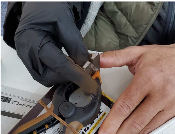
(ゲージ)・・・小さな部品をゲージの機械に通し大、中、小と選別していきます。