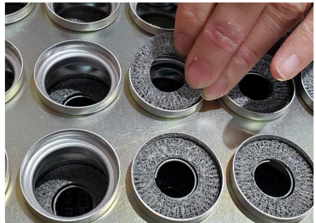
(フリセット)・・・トレイに3種類の部品をセットしていきます。