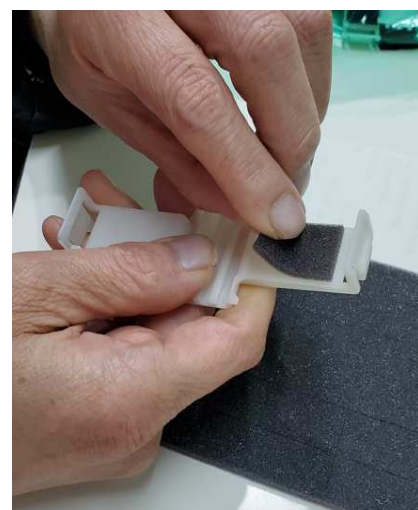
(シール貼り)・・・車の部品です。決められた場所にシールを2か所貼っていきます。