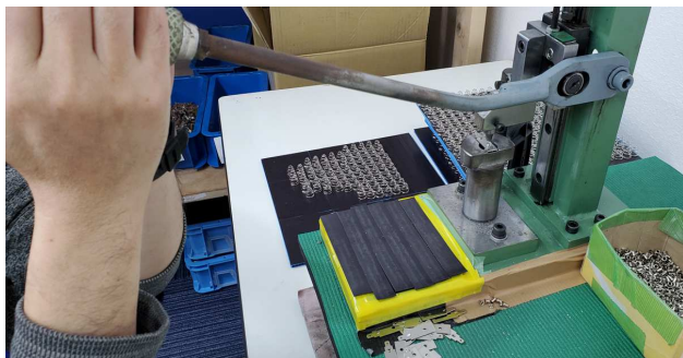
(組み立て作業)・・・必ず誰もが一度は目にしたことがある乾電池の部分を1ヶずつ組み立てていきます。