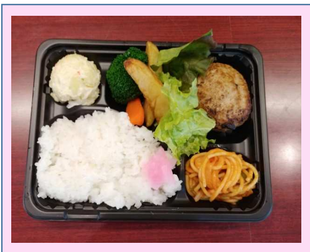
弁当作成です。多い日は一日70個以上 作ります。