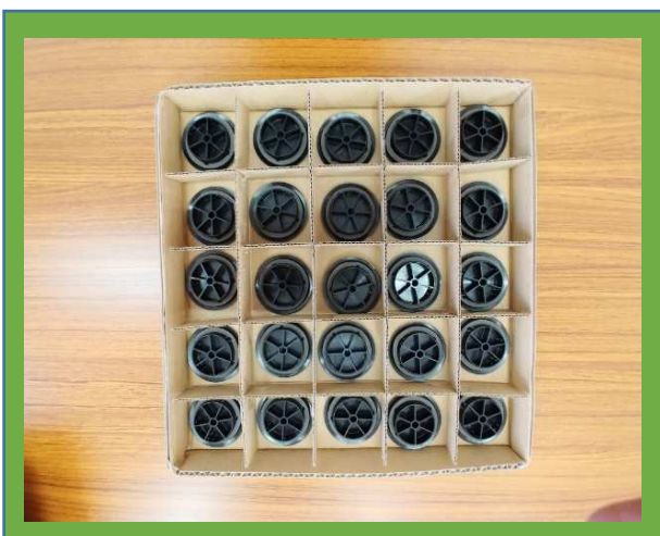
ウレタン取り付けです。 マスに並べることで25個数えられます。