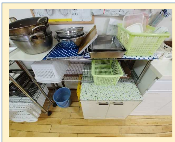
食器の洗浄、拭き上げの仕事です。 緑色のかごが洗ってあるもの、白色のかご が拭き終わったものと、色でも分かるよう にしています。