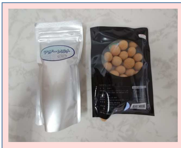
塩やナッツの軽量作業もあります。