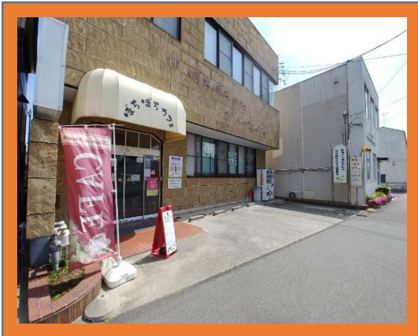
ほちほちカフェ外観