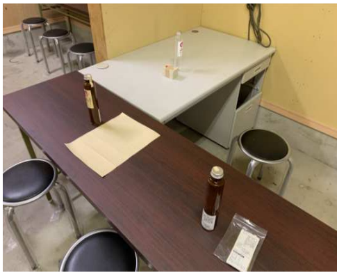
←各種ラベルシール貼り