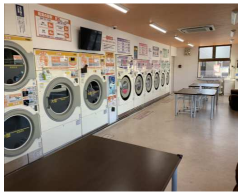
店内各種掃除、POP貼替、SNS発信、その他