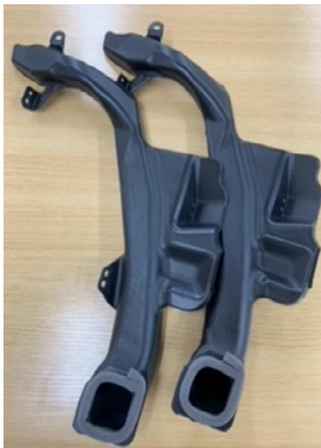
050-pパッキン シール 貼り