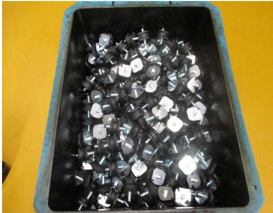
自動車部品 組付け作業