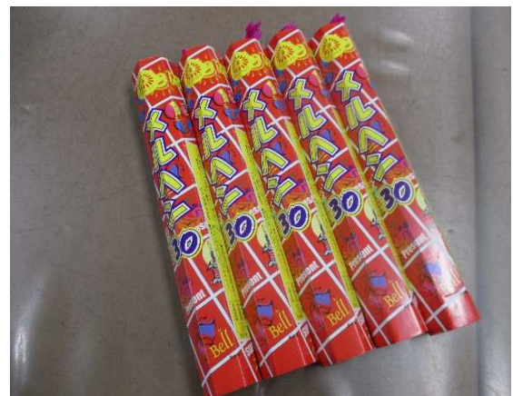
花火 ボンド・テープ 貼り等