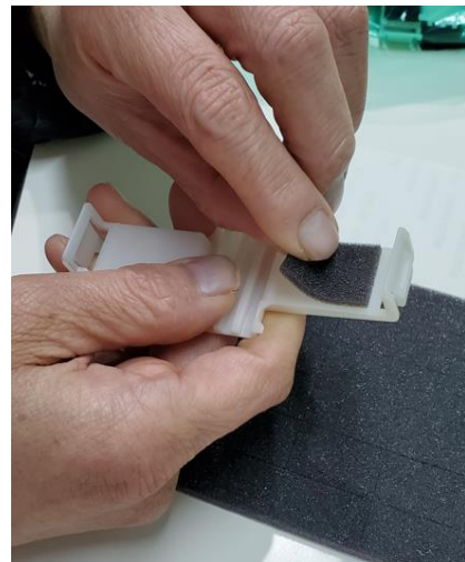
(シール貼り)・・・車の部品です。決められた場所にシールを2か所貼っていきます。