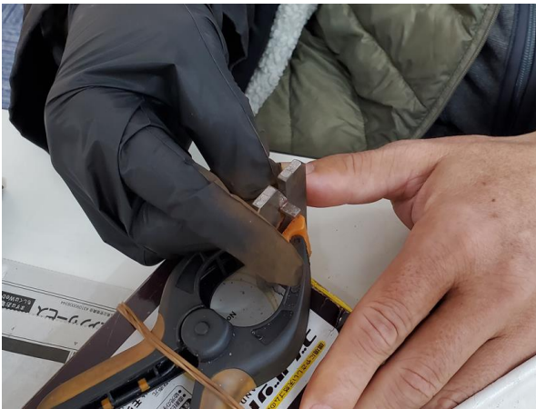
(ゲージ)・・・小さな部品をゲージの機械に通し大、中、小と選別していきます。