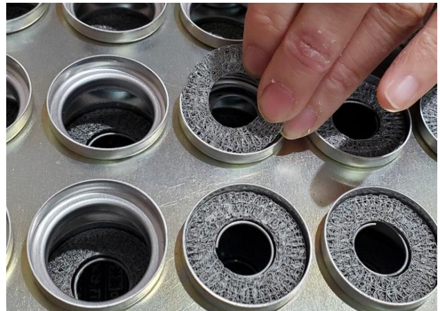
(フリセット)・・・トレイに3種類の部品をセットしていきます。