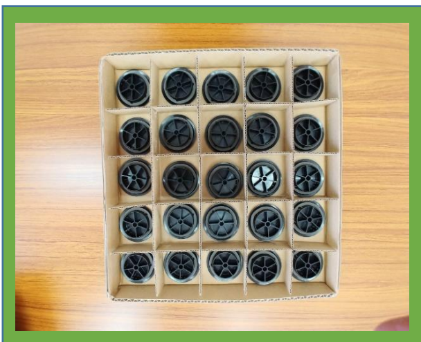
ウレタン取り付けです。 マスの並べることで25個数えられます。