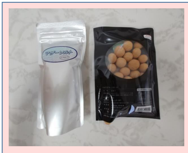
塩やナッツの軽量作業もあります。