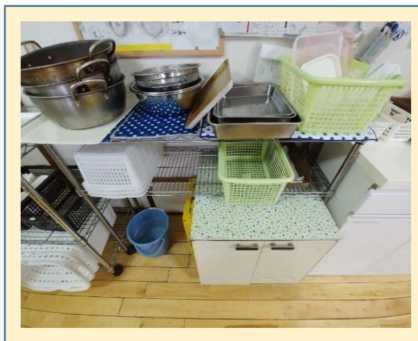
食器の洗浄、拭き上げの仕事です。 緑色のかごが洗ってあるもの、白色のかご が拭き終わったものと、色でも分かるよう にしています。