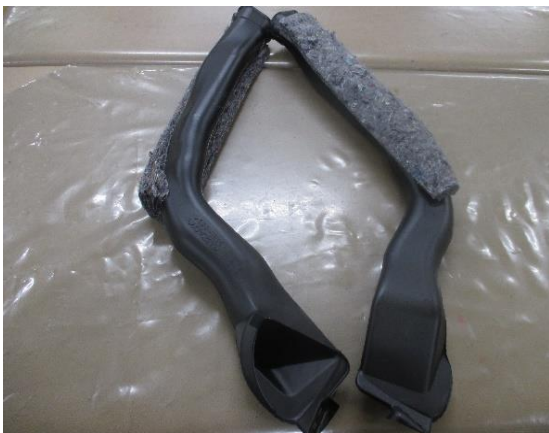
サイドデフ シール貼り