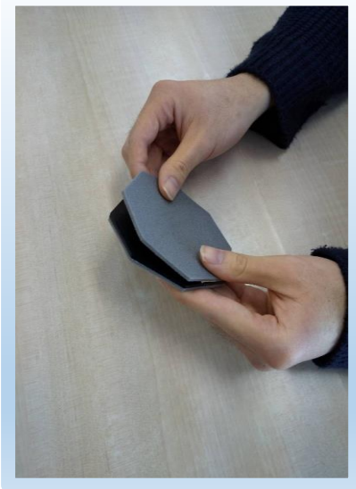
八角のプラ板に合わせて両面にウレタンを貼り合わせます。