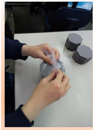
床保護用マットの梱包作業です。