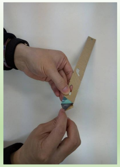
大小様々な種類のバリ取りや包装作業があります。