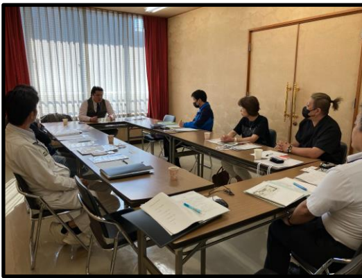
令和6年9月4日 コレワーク中部セミナー