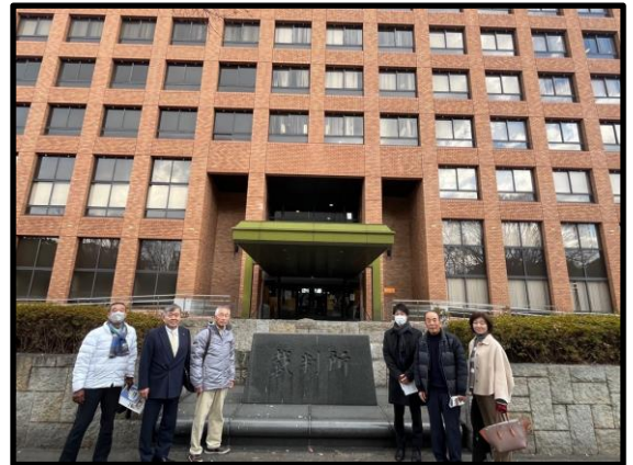
県内研修：令和7年1月9日 名古屋地方裁判所