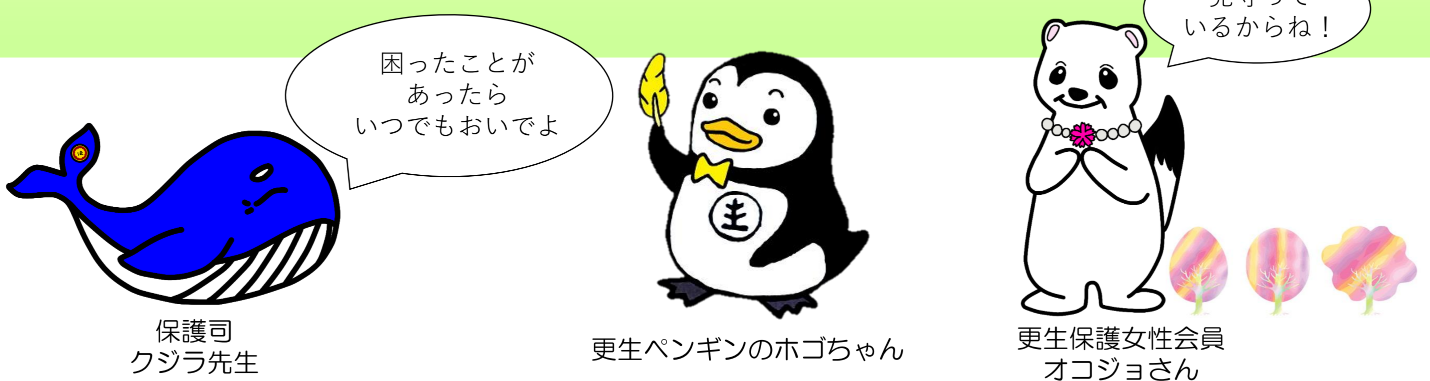
保護司 クジラ先生

“社会を明るくする運動”を通じて、更生保護の思いやボランティアの活動について知っていただき、みんなで安全・安心な地域を築いていくきっかけにしていただければうれしいです。