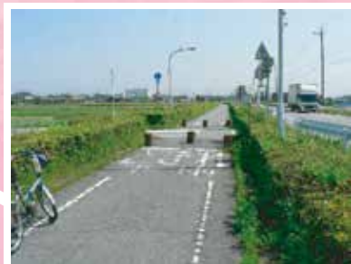
●県道豊田安城自転車道 (東井筋) 約13km