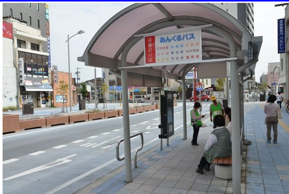
< JR安城駅の様子 >