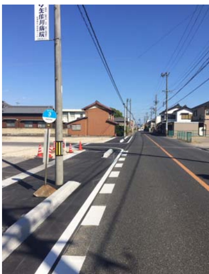
< 現在 >