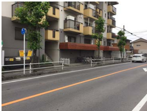
（変更後）集合住宅前