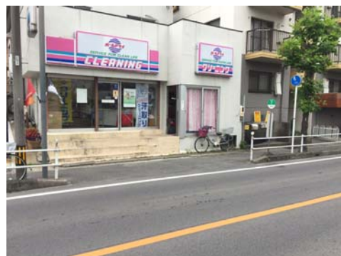
（現在）クリーニング店前