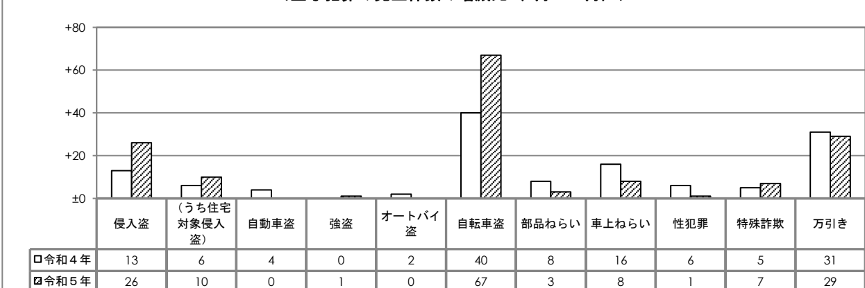
<主な犯罪の発生件数の増減比（1月～3月）>