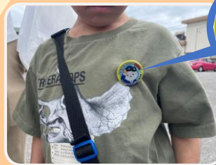
町内ふれあい防犯ウォークラリー