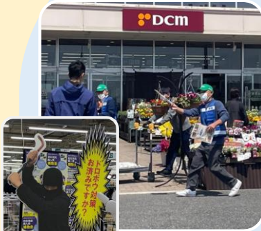
侵入盗防止キャンペーン