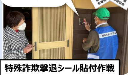
特殊詐欺撃退シール貼付作戦