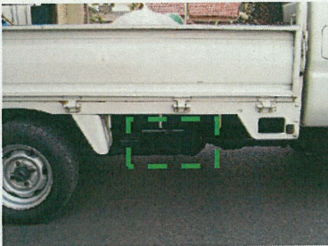
写真3：荷台下側面部ツールボックス

施設修理用の小道具（ドライバ、プライヤ等）を 収めておく小箱。車体外側に向かって開く側面フタ希望。 材質はステンレスがベストだが鉄鋼板（要錆止め）でも可。 400×200×200くらいで。