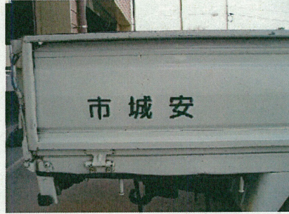
写真2：鳥居 ロープ等引っ掛けフック