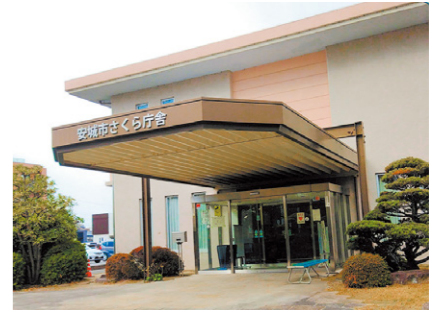
市役所本庁舎から徒歩3分のさくら庁舎にあります。