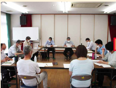
▲困りごと解決に向けた支援について話し合い