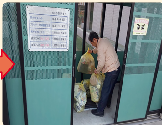
▲ゴミ出し支援を行う福祉委員