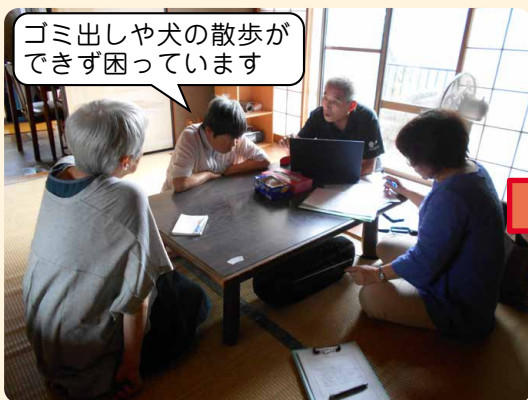
▲視覚障がいのある人の自宅に訪問して困りごとの相談