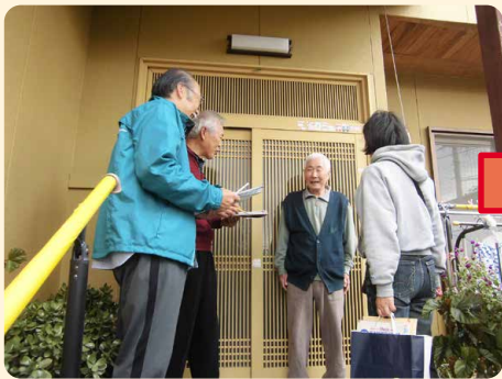
▲困りごとやお手伝いについての聞き取り