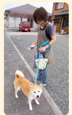
▲犬の散歩を代行する近所の協力者