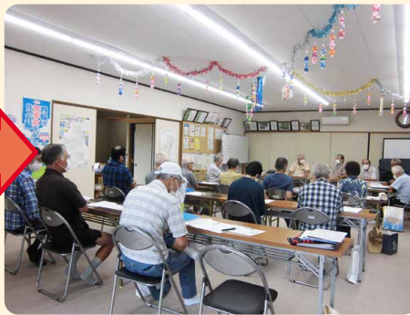
▲訪問結果と各組長からの情報を共有