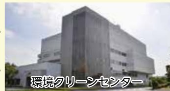
環境クリーンセンター

家庭の大掃除等で出た多量のごみ・粗大ごみは、早めに環境クリーンセンター・リサイクルプラザへ搬入してください。搬入時は、手数料の納付のため小銭を用意してください。