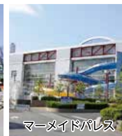
マーメイドパレス