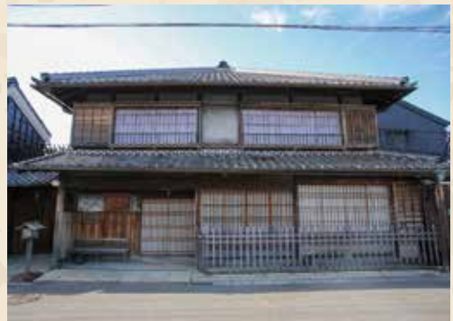
平成16年に国の登録有形文化財に登録された半田市小栗家住宅。明治初年頃の建築と推定される。