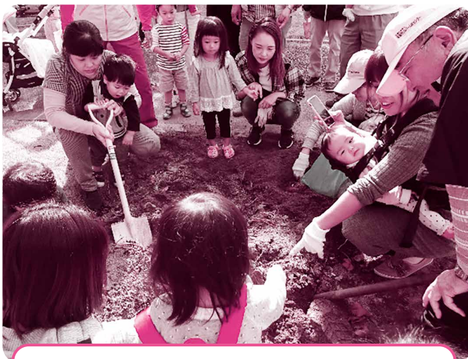
親子芋掘り体験に協力している様子 大きなお芋が土の中から出てきてびっくり!

「センターまつりで、来場者のみなさんに切り花や野菜を配布したときの喜ぶ顔が嬉しいです」「冗談を言ってみんなで笑いながら作業をしているとき、元気とやる気が満ちてきます」、「植物の育て方で知らなかったこともたくさん教えてもらい、勉強になります」など、グループの活動には、やりがいや楽しいことがたくさんあり、活動の輪が広がっています。