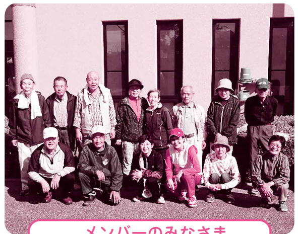
メンバーのみなさま

現在は15人までメンバーが増えました。活動に参加しようと思ったきっかけを聞くと「花が大好きだから、ためらいなく入会しました」「野菜と花作りは、老後の元気の源になると思いました」「他県より引っ越してきて話し相手もおらず困っていましたが、家族が紹介してくれました」と話され、メンバーは小さなきっかけから参加されています。