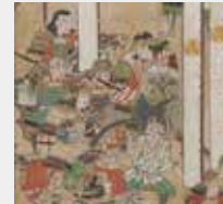
長篠合戦図屏風(犬山城白帝文庫蔵)