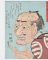
歌川國芳 「みかけハこハるがとんだい」人だ