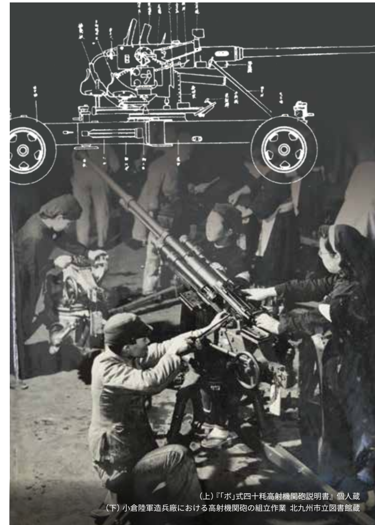
(上)『「ボ」式四十耗高射機関砲説明書』個人蔵