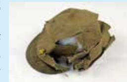
航空整備兵(陸軍)が、アメリカ軍の爆撃で亡くなった身に付けていた軍帽(本館蔵)

今回の展覧会では、将兵たちが経験した「戦争」とはどのようなものだったのか、彼らが遺した品々を通して紹介します。