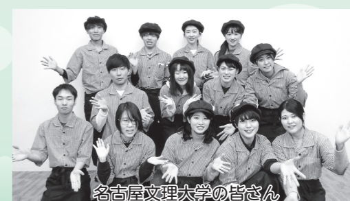
名古屋文理大学の皆さん