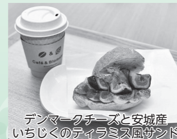
デンマークチーズと安城産いちじくのティラミス風サンド

二人にとって思い出深い場所で挙式ができること、大変嬉しいです。当日は私達だけでなく、親族やお世話になった方々、そして同じ場所・時間を共有する皆さんとともに、きれいなお花や風景に囲まれて、穏やかで幸せな気持ちになれる日にしたいです。