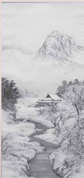
水野桜山(初雪之里図)